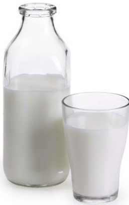
Latte UHT, latte intero