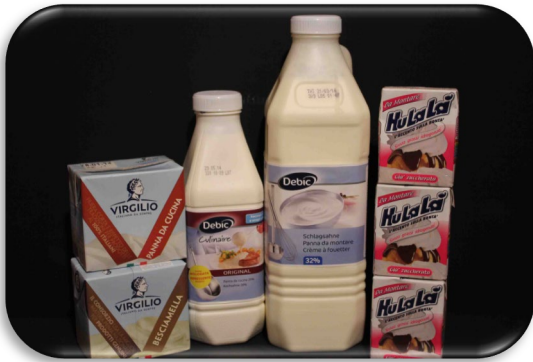
Panna da cucina Panna Vegetale Becciamella