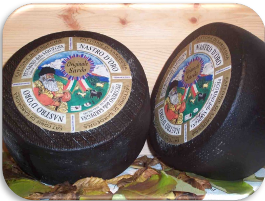
Pecorino fiore sardo blu