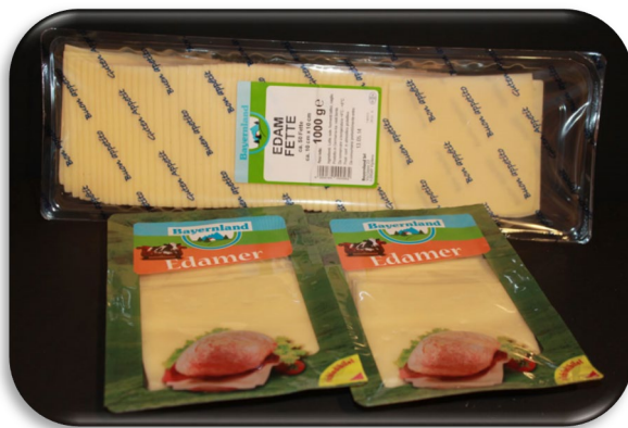
Edamer a fette