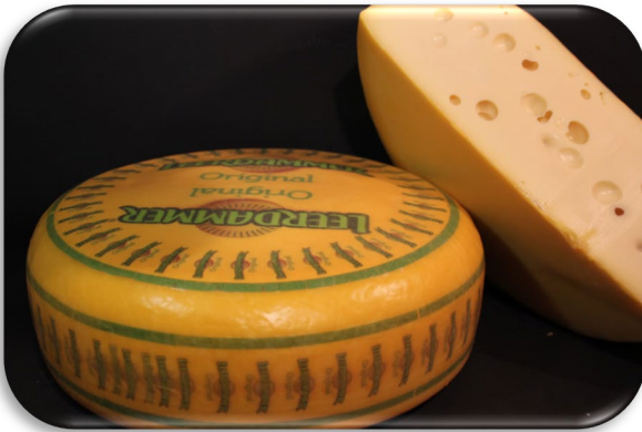
Formaggio olandese Leerdamer